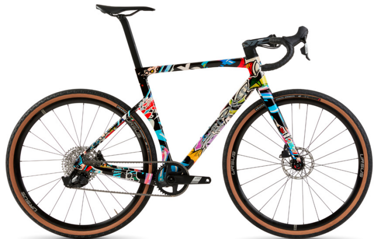
- 95-26 -

La colorazione «RTA - Ride The Art» è disponibile con un sovrapprezzo di 590,00 €.