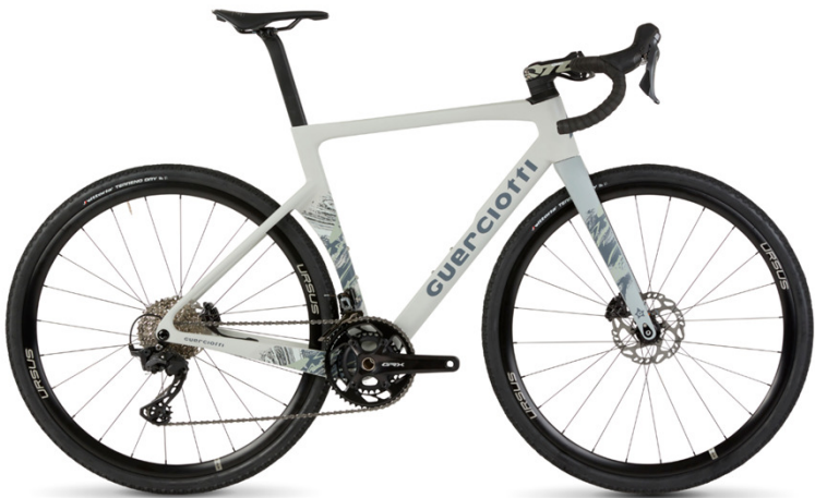
- 50-26 -