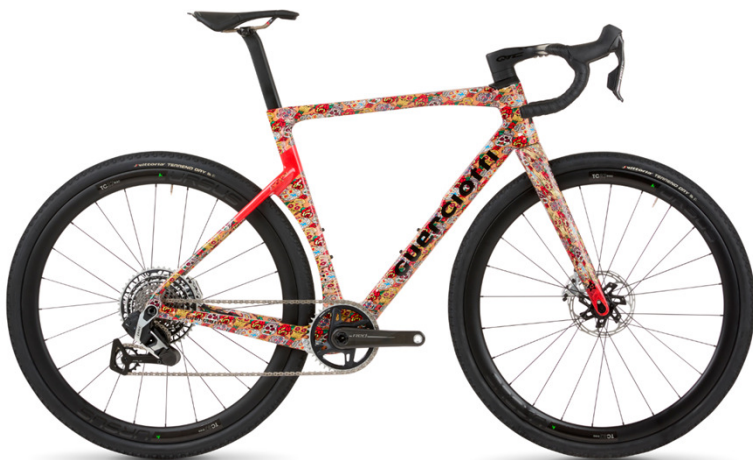
- 92-26 -