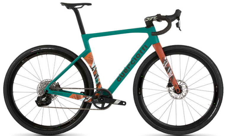
- 03-26 -