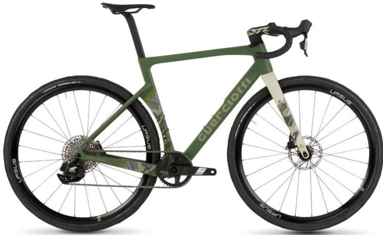
- 60-26 -